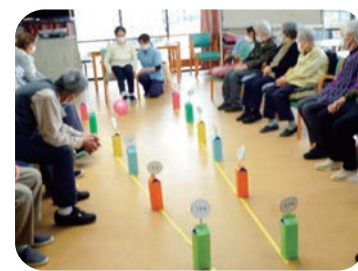
どこまで蹴れるかな