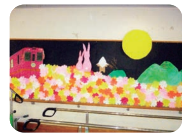
秋の壁面制作(お月見)